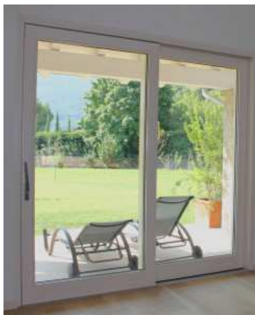
Alzante scorrevole HS modello Eternity Plus

serramenti in legno-alluminio di Alpilegno viene applicato il legno lamellare “netto” di prima scelta certificato PEFC e FSC e i profili di tenuta sono a tripla o quadrupla battuta. La parte esterna è composta da alluminio in lega EN AW6060 T5, verniciato secondo regolamento Qualicoat o con trattamento di ossidazione anodica in classe 15 secondo specifiche del marchio EURA EWAA QUALONOS . La soglia inferiore della portafinestra, alta 25 mm, esternamente è in alluminio per permettere una maggiore durata, mentre internamente è in materiale plastico per garantire al meglio il “taglio termico”. Infine, il vetrocamera è dotato di profili distanziatori termici in PVC (bordo caldo) che riducono al minimo il rischio di formazione di condensa sul vetro e la trasmittanza termica del vetro.