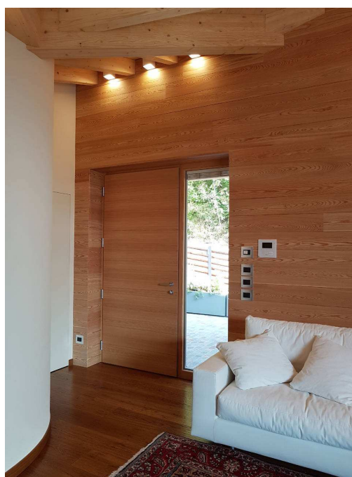
Clima 72 by Alpilegno

Clima 72 di Alpilegno è il nuovo portoncino d'ingresso antisfondamento composto da telaio fisso e anta mobile dello spessore di 72 mm con profilo di tenuta a tripla battuta e spigoli inclinati, è realizzato in legno lamellare "netto" di prima scelta certificato PEFC. L'anta è realizzata internamente con materiali che assicurano elevate prestazioni di stabilità, durata nel tempo e termo-acustiche. La verniciatura con prodotti Remmers protegge il legno con tre diversi strati di resina e le tre guarnizioni tra profilo telaio e profilo battente sono realizzate in gomma EPDM bimescolare con durezze differenziate per una migliore tenuta termo-acustica. La ferramenta è costituita da cerniere con una portata fino a 160 kg ad altissima resistenza alla corrosione, con tre regolazioni, che garantiscono livelli di resistenza all'estrazione superiori ai 1.500 kg, serratura di sicurezza a tre punti di chiusura e cilindro antitrapano con chiave piatta.