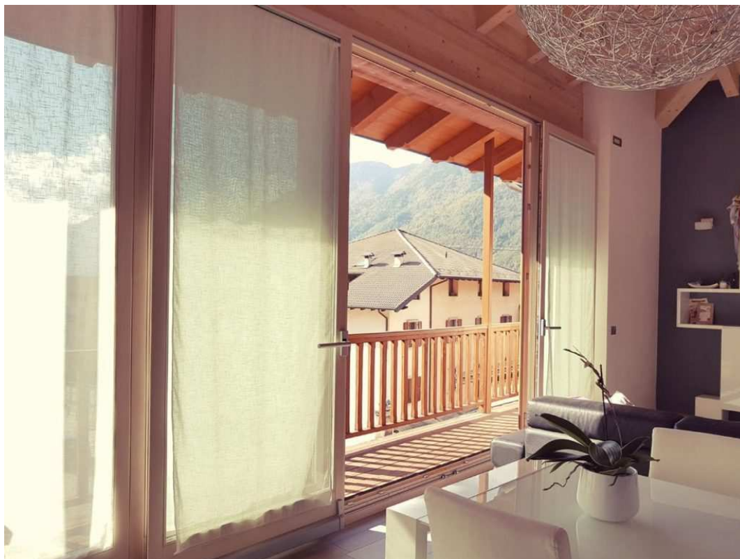
Scorrevoli Complanari Psk.