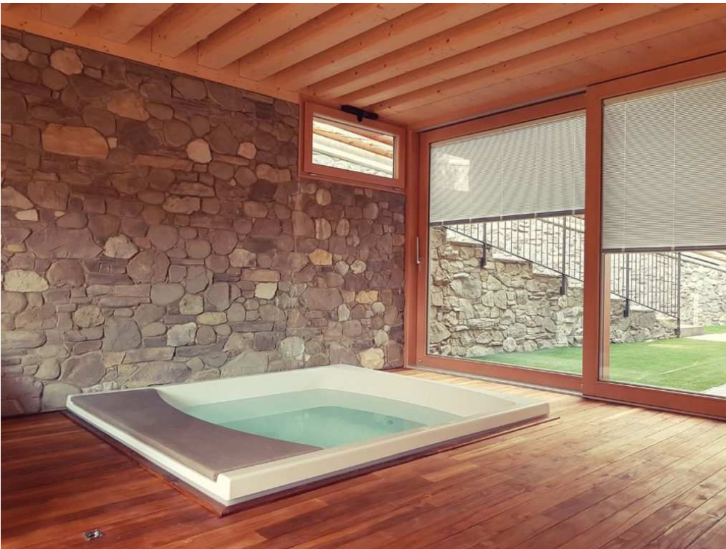
Scorrevole alzante Hs.

Caratteristiche: serramento in legno-alluminio, interno in essenza di Larice netto nodi ed esterno alluminio effetto legno per una maggiore protezione dalle intemperie. Ante entrambe scorrevoli e dotate di una tendina antisoletta filtrante motorizzata , integrata nel vetro, collegata all'impianto domotico.