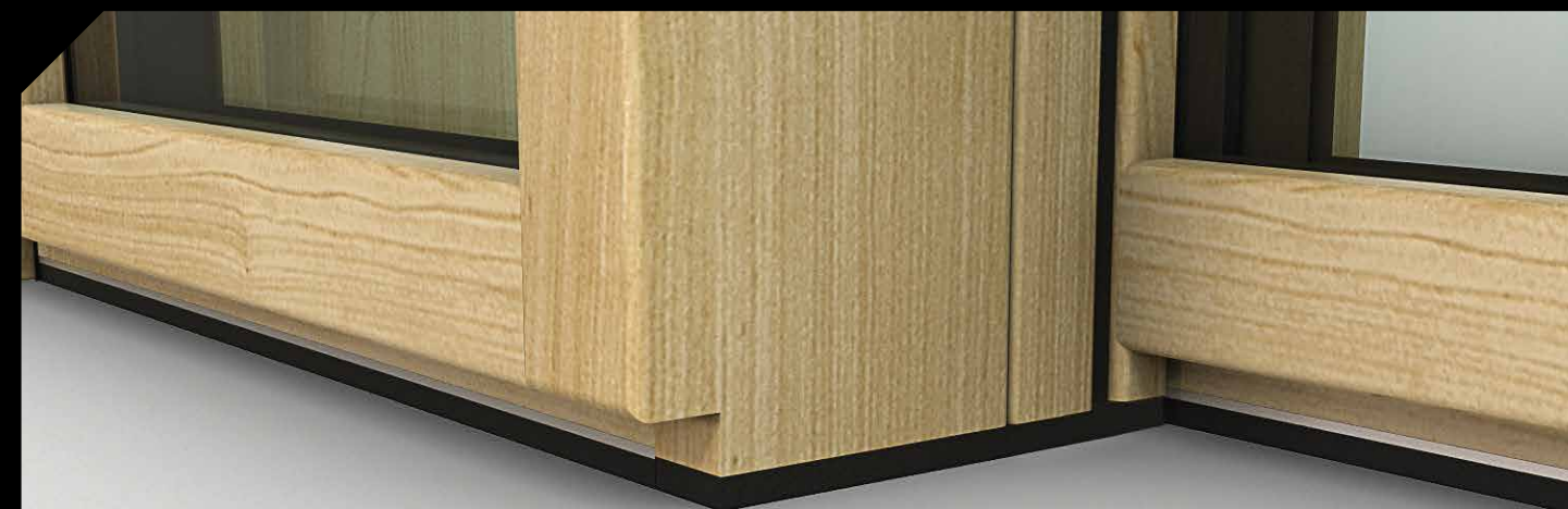
PARTICOLARE NODO CENTRALE - LATO INFERIORE

Punti di chiusura nel montante del telaio, che massimizzano resistenza e durabilità nel tempo.